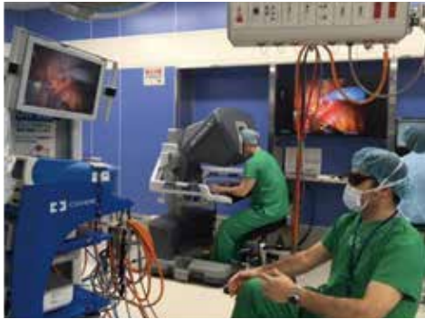
レジデントのロボット支援手術実施風景

全国の医学生・初期研修医の皆様、こんにちは。自治医科大学 腎泌尿器外科学講座主任教授の藤村哲也です。私のセールスポイントはロボット支援根治的前立腺全摘除・腎部分切除術・根治的膀胱全摘除術1,000例を超える経験です。“1000例を20例で伝える”を目標に日々、若い先生に技術の伝承を熱心に行っています。