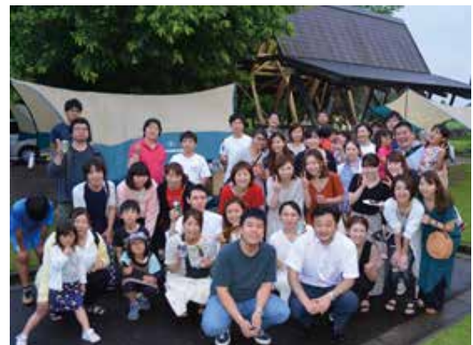
2018年に実施したレクリエーション