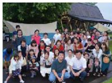
2018年に実施したレクリエーション