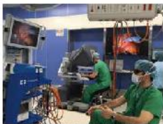
レジデントのロボット支援手術実施風景

全国の医学生・初期研修医の皆様、こんにちは。自治医科大学 腎泌尿器外科学講座主任教授の藤村哲也です。私のセールスポイントはロボット支援根治的前立腺全摘除・腎部分切除術・根治的膀胱全摘除術1,000例を超える経験です。“1000例を20例で伝える”を目標に日々、若い先生に技術の伝承を熱心に行っています。